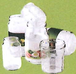
Pots & bocaux en verre